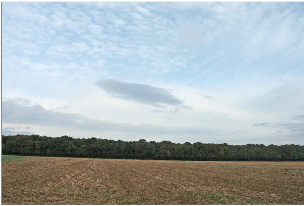
Eolienne n° 7 : Vue avant implantation